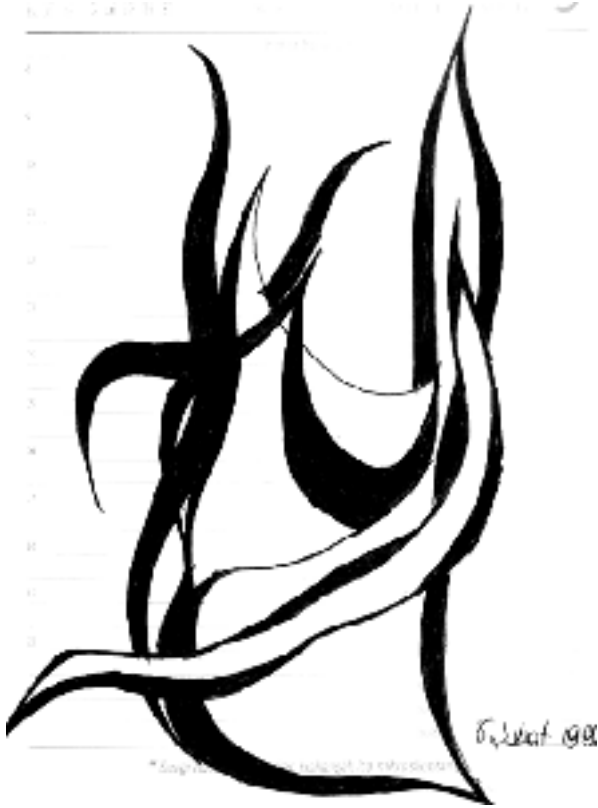
Desen: Sinem Öztürk